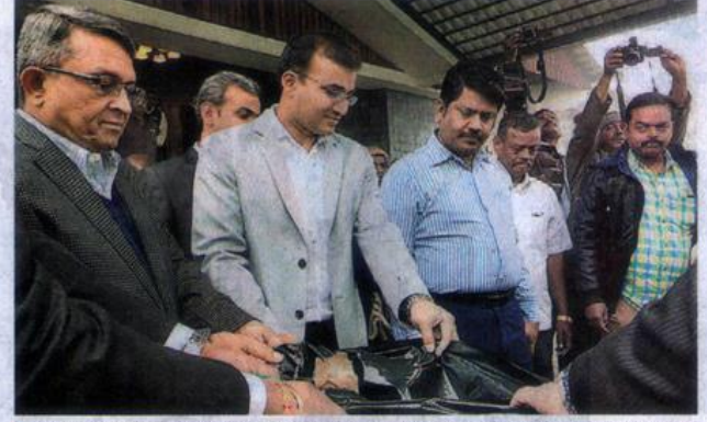
🔺 கொடைக்கானல் ஏரிச்சாலை தூய்மைப் பணியை தொடங்கிவைத்தார் மாவட்ட ஆட்சியர் டி.ஜி.வினய்.

யுள்ள பகுதிகளில் குப்பைகள் சேகர திட்டம் கைவிடப்பட்டுள்ளது. இதுகு